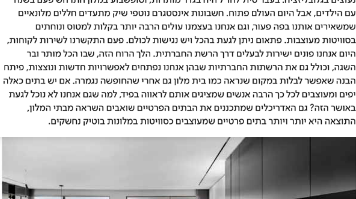
החלל הביתי החמים מגיע מניו יורק וממראה הרחוביים, מתנוע ערה וזרית פורצלן, צילום: איתי בנדר