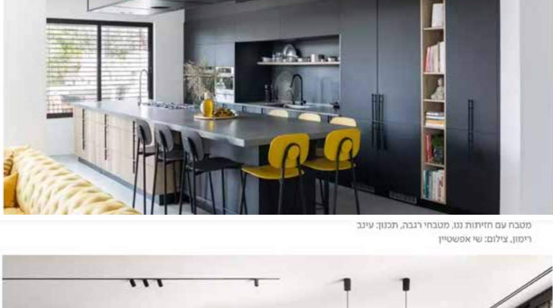
מטבח עם חזיתות בטון בגווני אפור, סטובל לרמיקה, עיצוב רותם בנאי ענת