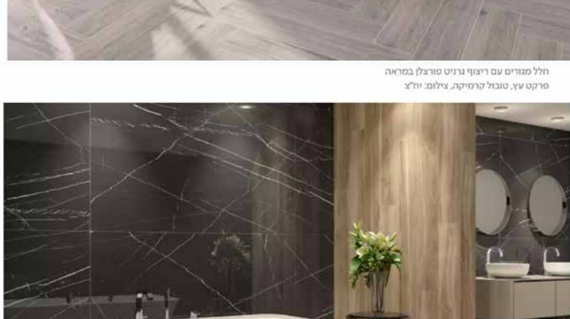
חלל מגורים עם ריצוף עץ, ריצוף גרניט פורצלן במראה סיקרונ, עץ, סטובל לרמיקה, צילום: יחיאל

חברות כמו וולט וגט דוגמאות מקומיות שהפנימו את הלך הרוח, וראות בנוחות ובזמינות ערכים מרכזיים, ומספקות שירות לצרכן שרוצה הכל בהתאם למה, וראות בבית נקודת זמן. חברות הליווי והכבלים מתאימות גם הן את עצמן, כשמאפשרות צפייה בהתאמה להרגלים האישיים של כל אחד, בניסיון לספק תשובה לענקית הסטרימינג נטפליקס, שהעבירה את כולנו שיעור בצריכה של צפייה בהתאמה אישית.