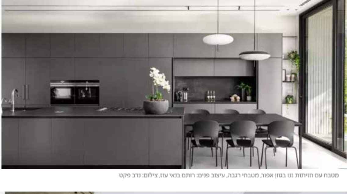
לא תראו אצבעות ושריטות – מטבח עם חזיתות בטון, עיצוב ירון, עיצוב רית וסלי