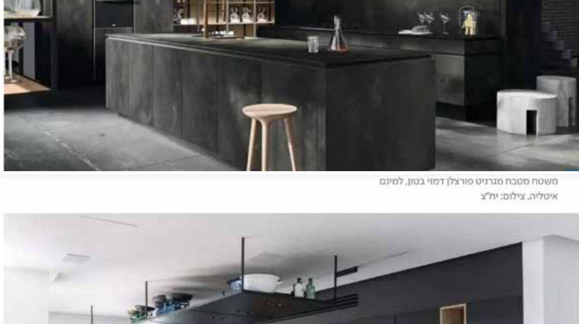
מטבח מותאם מגרניט פורצלן דפטי בטון