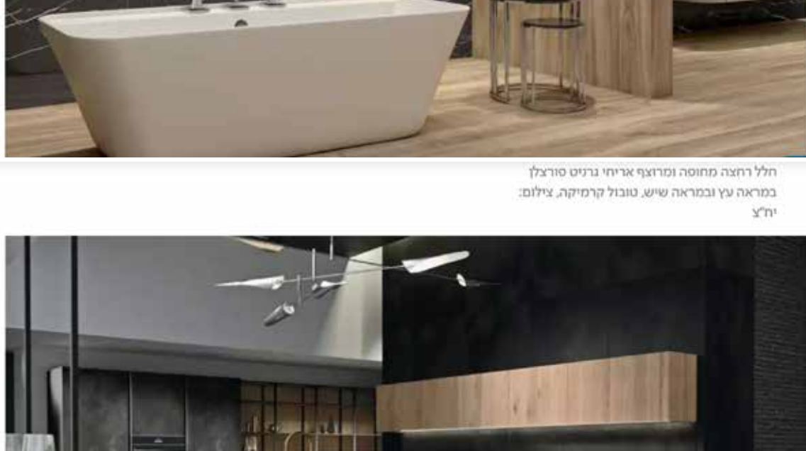
חלל רחבה מחומה ומרופץ אריזוני גרניט פורצלן במראה עץ, סטובל לרמיקה