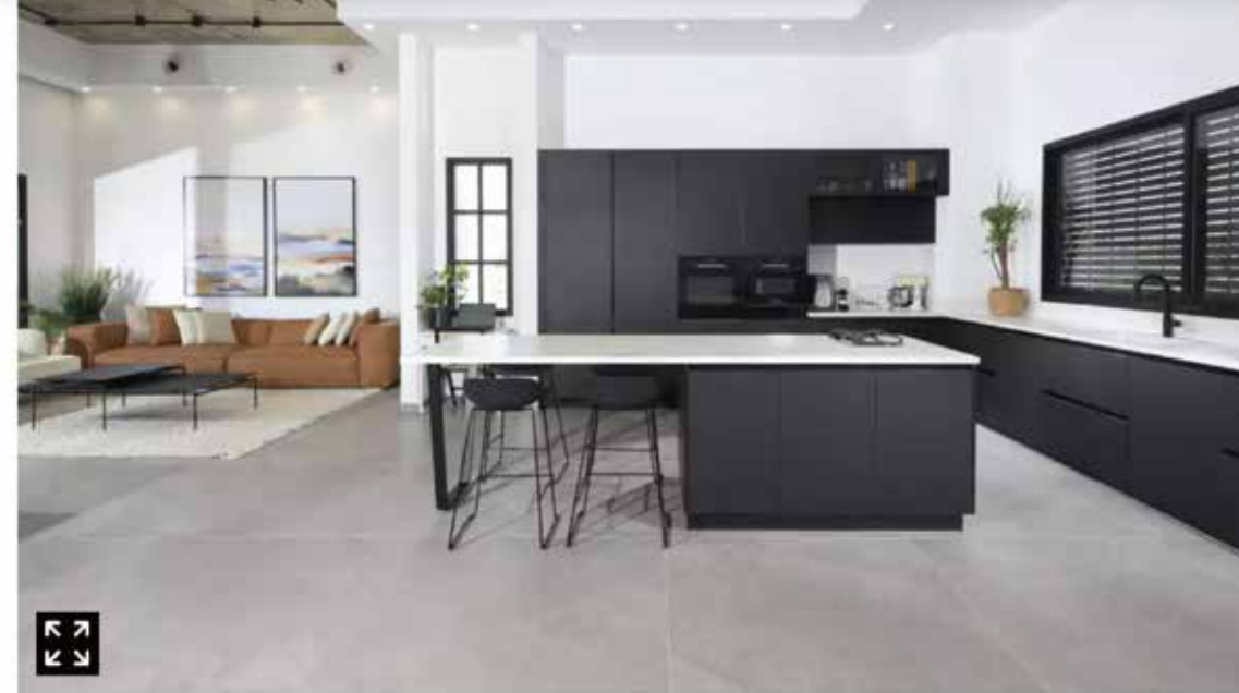
הרעיונות והבידוד הרבים שמתקיימים השוחרות הם המרכיבים המרכזיים שממחישים את התפתחות המגמה, PRAT LIVING