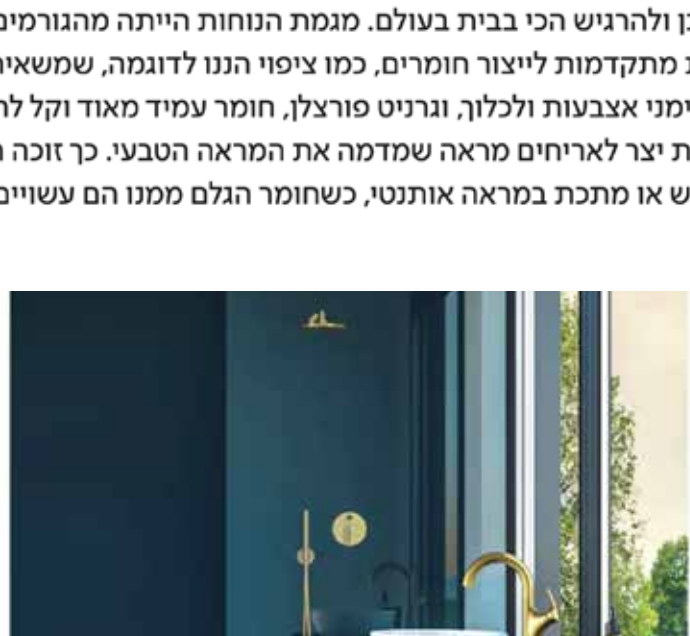
ברזים בהתאמה אישית – ברז מזהב מתון קולקציה TWIST BY HAMAT בעיצוב נול בוב, צילום: סטודיו פריאל

חברת נייקי הייתה מהראשונים שאפשרו לכל אחד לעצב את נעל הספורט לפי רצונו. בתחום הרכב יש לנו אפשרות לשחק עם צבעים ואלמנטים דקורטיביים שמבדילים את המכונית שלנו מהשאר, וגם כשמדובר בעיצוב הבית קיימות אפשרויות רבות: פאנלים של מוצרים שמאפשרים להחליף ביניהם לפי מצב הרוח או הסיטואציה, ארונות קור עם הדפסים של תמונות אישיות שנשלחות מהמחשב שלכם למפעל, ברזים שניתנים לעיצוב בהתאמה אישית ועוד.