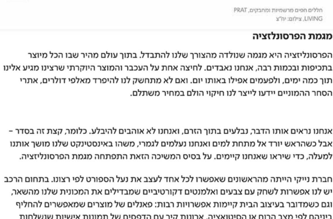
חללים פתוחים שמרמזות ומתקנים, PRAT LIVING

בדקנו מה הולכים להיות הטרנדים המובילים של שנת 2022 בעיצוב הבית ומה הם נימוקיהם, והנה הם לפיכך.