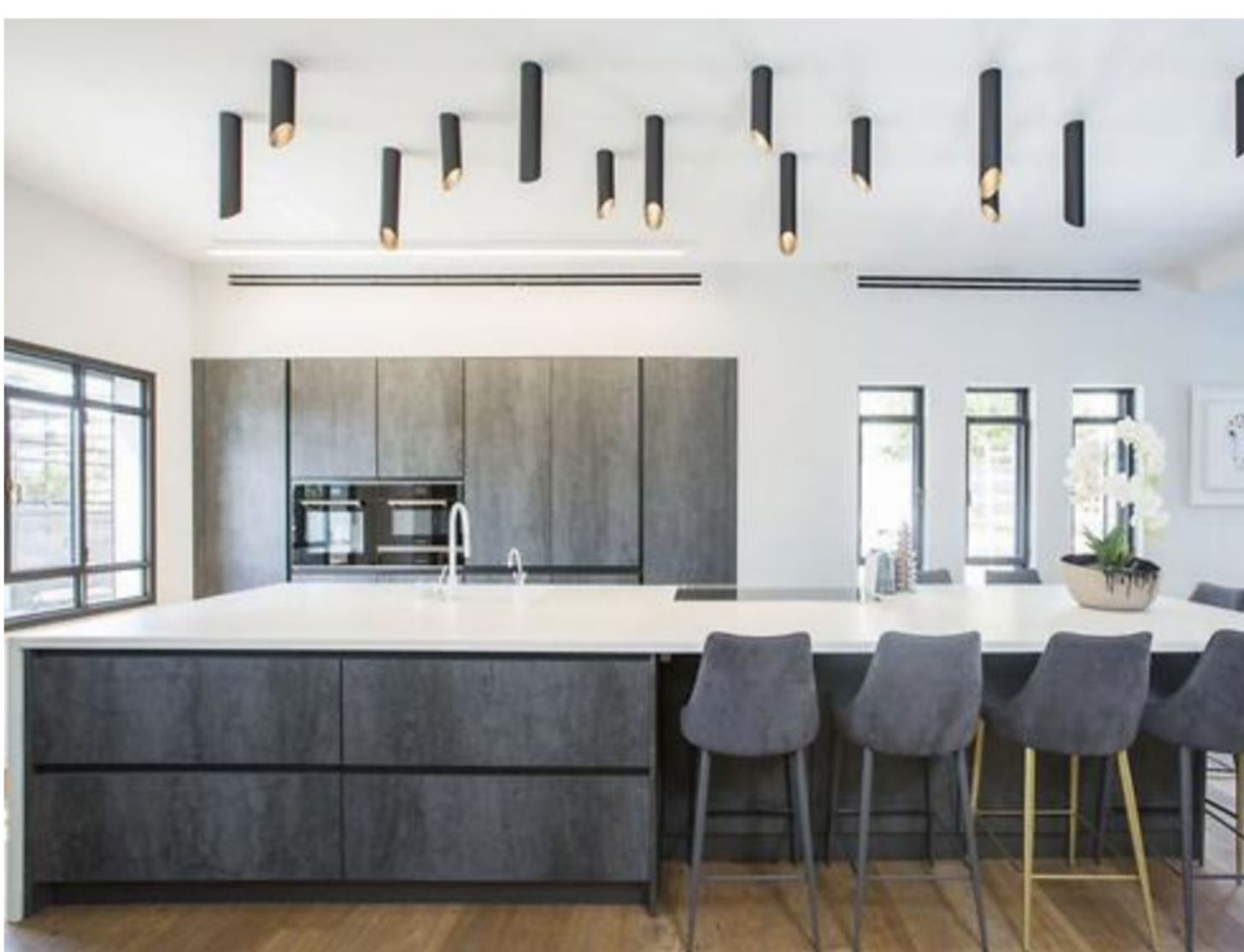
"המטבח הוא באמת המרכז של הבית". מטבחי רגבה. עיצוב: רותם בנאי עוז.

הפריט שמאזן את המטבח המודרני עם הקווים הישרים וגווני האפור-לבן הוא רצפת הפרקט, שהחליפה את רצפת האבן שהייתה לפני השיפוץ. "מדובר במשפחה מאוד חמה והפרקט מוסיף לבית חמימות. הוא בעצם הרקע של הבית. אם לא בוחרים רקע מחמם כמו פרקט, הבית בקלות יכול היה להפוך להיות קר, מנוכר ומלוקק. הפרקט מאוד חשוב בנראות של הבית".