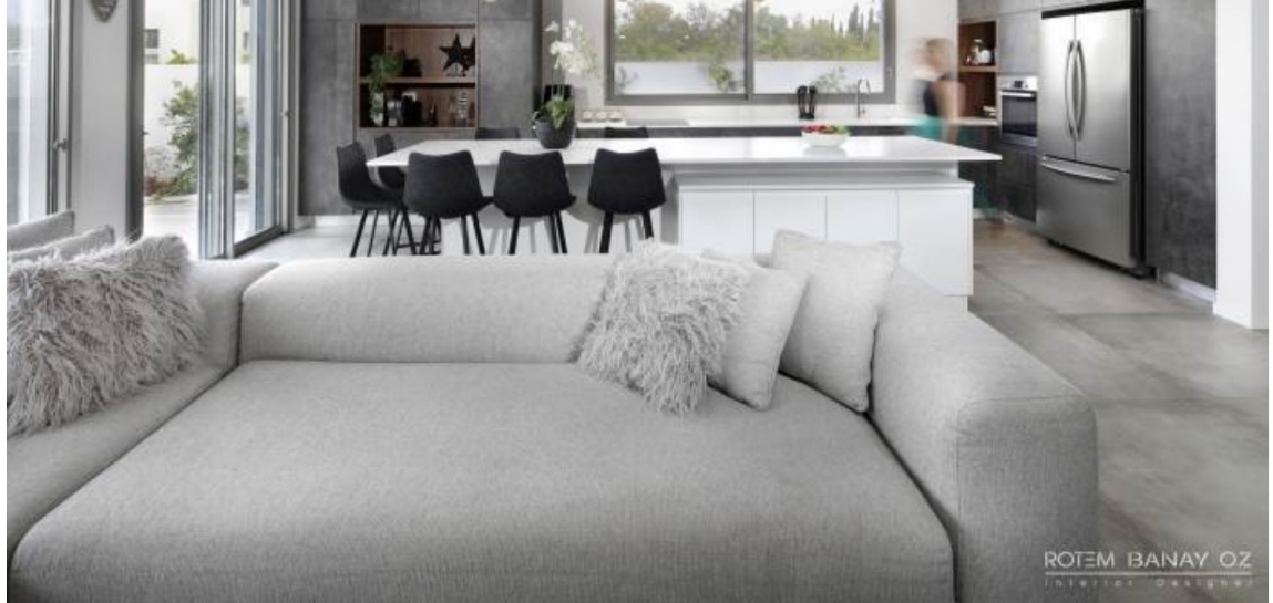
חלל המטבח היה מאתגר לאור העובדה שהוא צר וארוך

גם במטבח ישנה חדרה על פלסת החומרים והצבעים שחוזרים כחוט השני בכל האזורים.