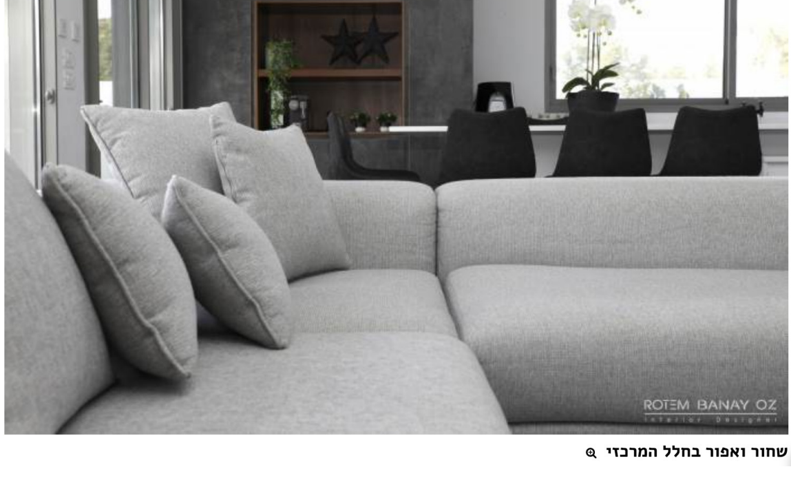
שחור ואפור בחלל המרכזי

פלסת החומרים והצבעים שנבחרו לכל הבית היו מודרניים ונקיים ושולבו בצבעי אפור, ברזל ועץ.