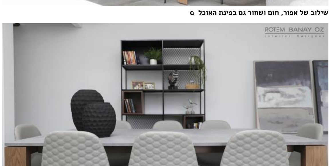
פינת אוכל מזמינה למשפחה צעירה שאוהבת לארח