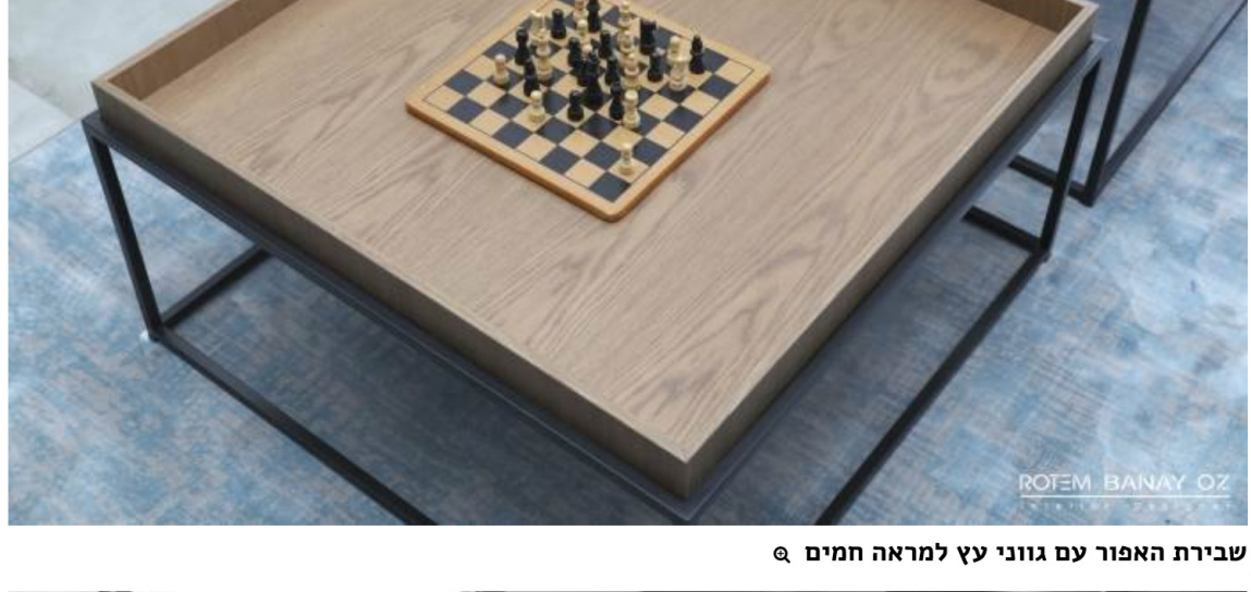
שבירת האפור עם גזוני עץ למראה חמים

הדיירים ביקשו לתכנן ולעצב עבורם בית פונקציונלי, פרקטי, צעיר ונוח אשר יתאים לאורח החיים התוסס שלהם ויאפשר להם לארח בבתים חברים ומשפחה.