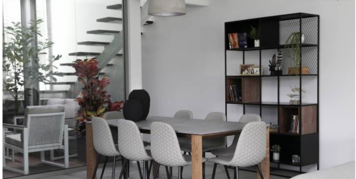
שילוב של אפור, חום ושחור גם פינת האוכל