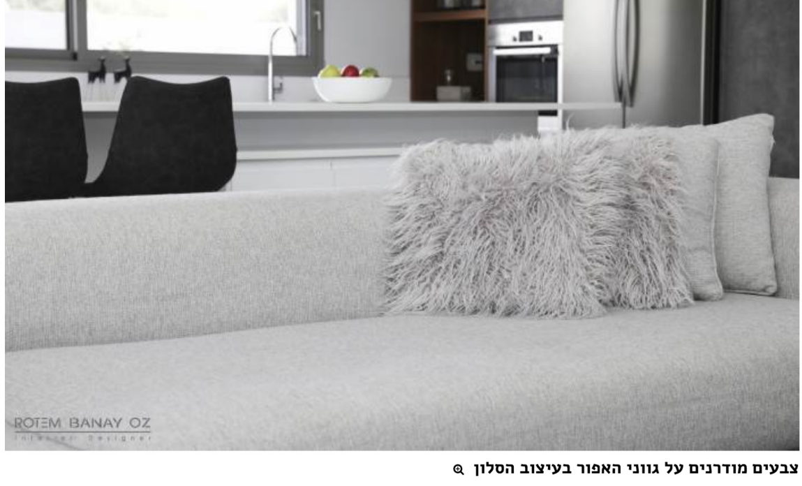
צבעים מודרניים על גזוני האפור בעיצוב הסלון