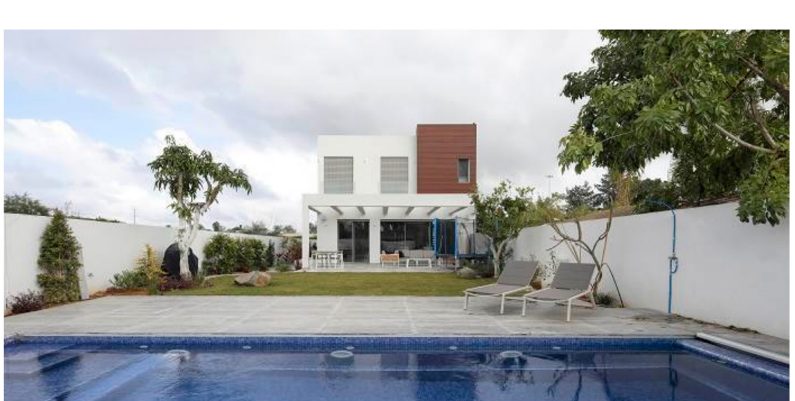
מבט מבחוץ אל הוילה היפה